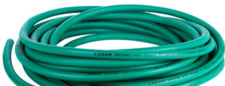
Mangueira Verde (Oxigênio)