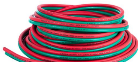
Mangueira Dupla (Oxigênio/Acetileno)

FT: 220/22 - Revisão: 001 - Data: 19/02/2024