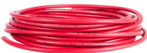
Mangueira Vermelha (Acetileno)