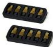
Pedras para o Centelhador - Embalagem com 10 unidades